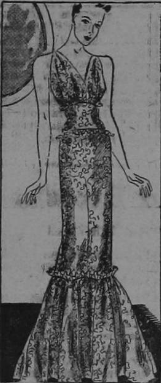
Evening frock for a trip.